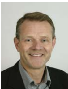
Formand for Sundheds-, Idræts- og Fritidsudvalget