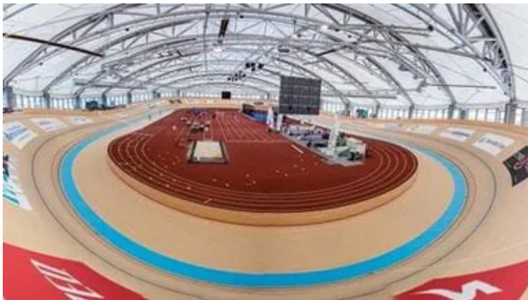
Thorvald Ellegaard Arena

Facilitetsstrategien tager udgangspunkt i en række principper, der afspejler byens udvikling, facilitetsstatus samt anbefalinger til handlinger.