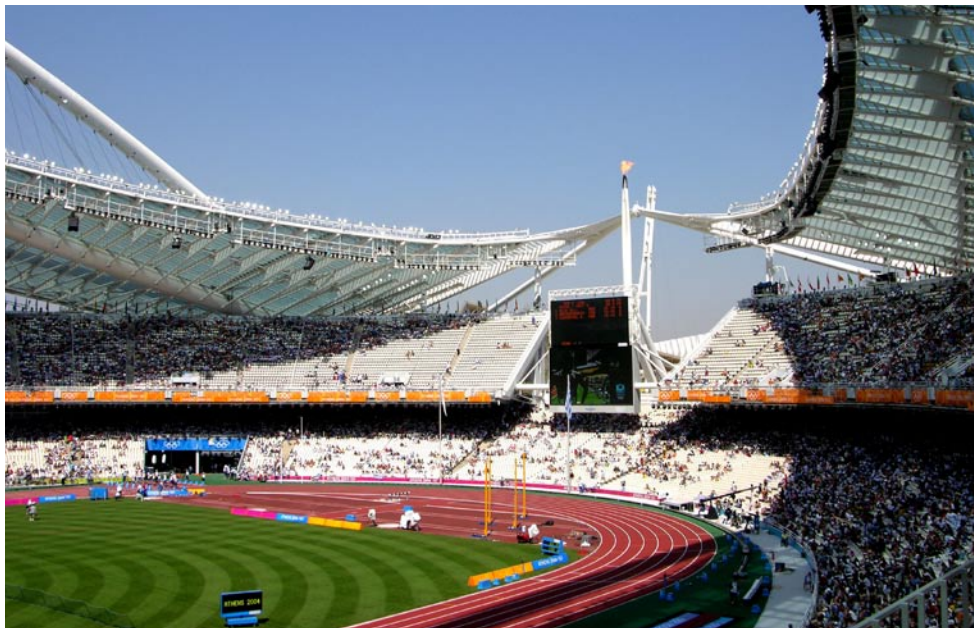
Danmark har potentialet til at blive vært for OL, som Grækenland og Athen var det i 2004.

Tilmeldingsfristen er den 24. august. Læs mere om konferencen og programmet på www.frivillighedsus.dk .