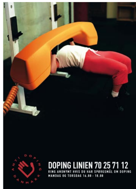
Plakat fra Anti Doping Danmarks kampagne-materiale, der er målrettet motionsdoping.

"Vi vil i princippet gerne have alle centre med, men i forhold til, at ingen andre lande har en lignende ordning, er det kanon godt. Vi oplever en stigende interesse for at komme med, men vi har haft proble-