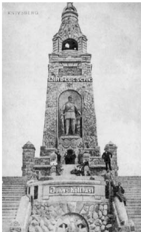
Det 45 m høje granittårn på Knivsbjerg. På foden af tårnet står turnernes valgsprog »Jungs holt fast«. Oven over kolossalstatuen af Bismarck et citat fra en af hans rigsdagstaler (1888) »Wir Deutsche fürchten Gott und sonst nichts auf der Welt«.

Turnbevægelsen bredte sig under aktiv medvirken fra Flensburger Turnerschaft til de tre af de større nordslesviske byer, Tønder, Åbenrå og Haderslev. I disse byer dannede tysksindede turnforeninger, der meldte sig ind i »Deutscher Turnerschaft«. 24 På denne måde kom turnbevægelse til at indgå som en vigtig bestanddel i bestræbelserne på at »fortyske« nordslesvig.