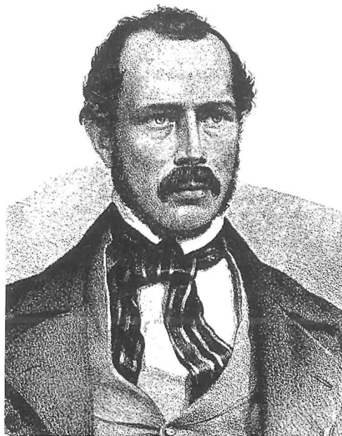
Guvernør Edward Carstensen. Efter samtidig litografi.

Det lykkedes faktisk Carstensen de første år at gøre fremskridt, og i begyndelsen af 1844 rejste han til Danmark, hvor han hos Chr. d. 8. vandt en vis forståelse for sine