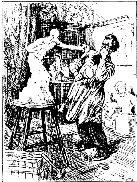
„Kunstnerrisiko“. Fra „Jul for Sportsmænd“ december 1935.

„Jul for Sportsmænd 1935“ hed også „Mr. Smiles Julenummer“. Mr. Smile var