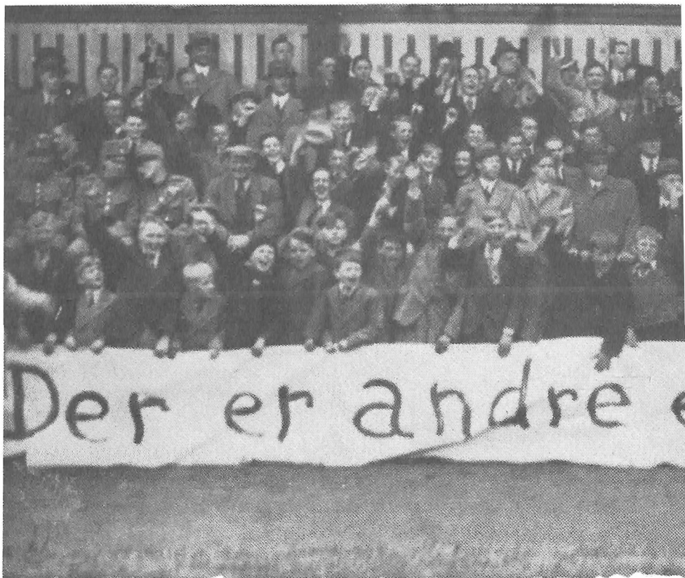
„Der er andre end AGF der du“. Transparent fra AIA's tilhængere på Århus stadion. Fra en samling af Aage Fredslund Andersens sportsbilleder fra 1930'erne. (Lokalhistorisk samling.)

frigørende, herunder hvilke befolkningsgrupper knytter de systemtilpassende elementer sig til, og hvilke befolkningsgrupper knytter de frigørende elementer sig til. (Jvf. „Idræthistorisk Årbog nr. 1“ s. 26).