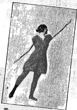
Træningsdragten, Mønsterbeskyttet Facon.