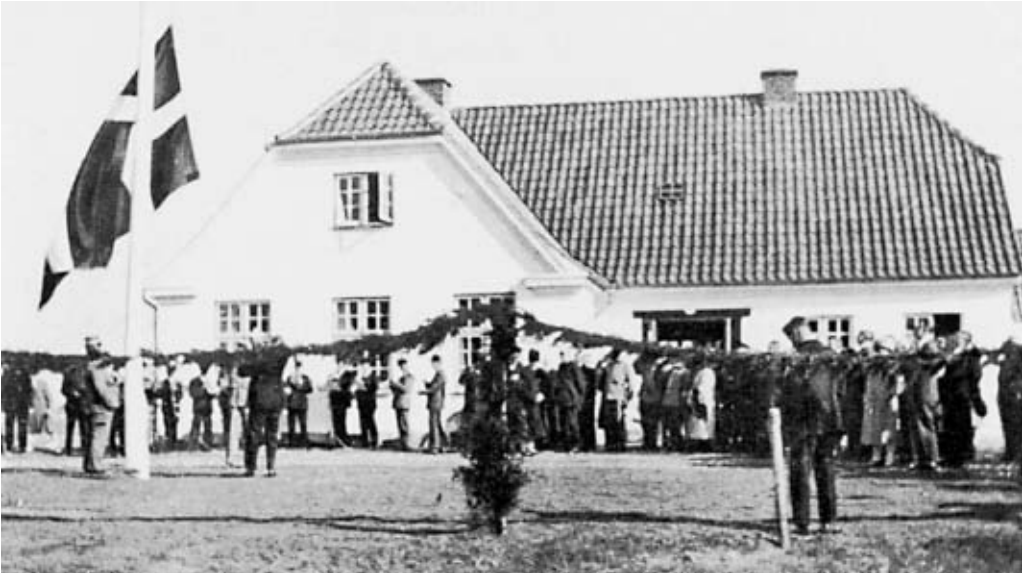
Indvielse af Jyndeved forsamlingshus i 1929. Jyndeved ligger syd for Tinglev tæt ved grænsen i et område med mange tysksindede – et område der er blevet betegnet som »Den truede firkant.«.